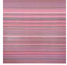
Love 02, 2022, Öl auf Leinwand, 200 x 200 cm, € 12.000.-